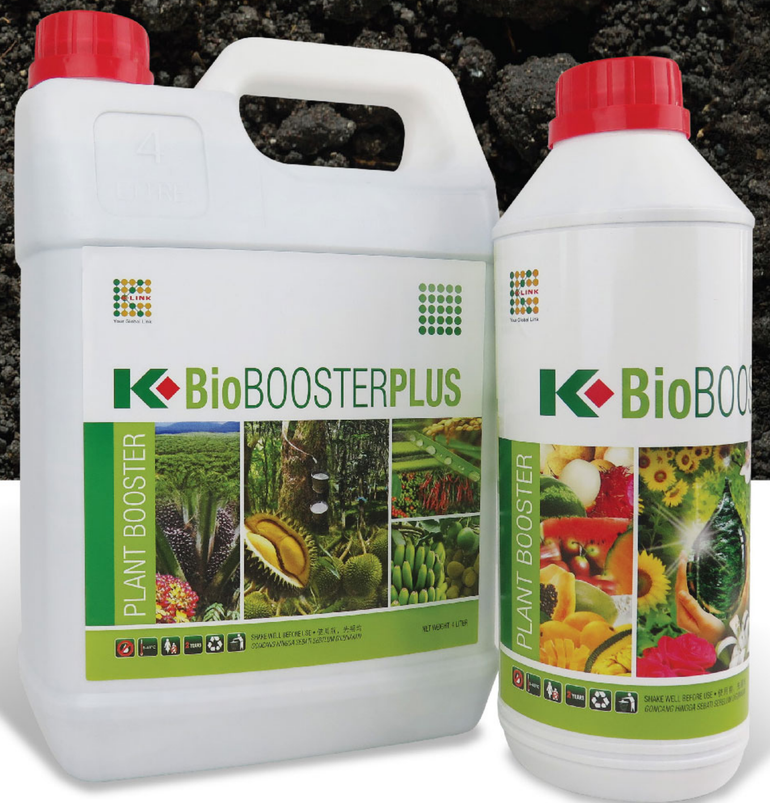
康立生物能量肥料PLUS（4公升）

康立生物能量肥料PLUS使用曾荣获国际大奖的生物科技配方，以多元化的益生菌所产生的生物能量，用于修复及滋养我们的花卉以及农作物。此配方也加入了各类氨基酸、富里酸、多量营养素（N、P、K）、微量元素和海藻精华以塑造健康的土壤及茁壮的农作物。